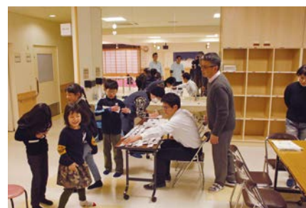
受付の様子。名札をもらってから勉強や遊びをします。