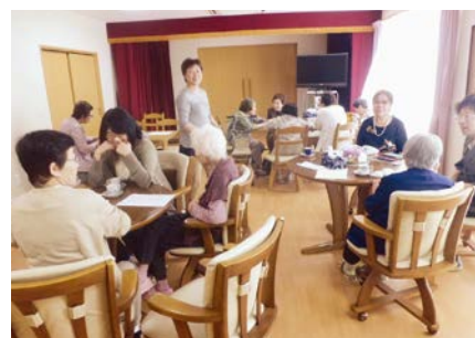
様々な方々と交流できています