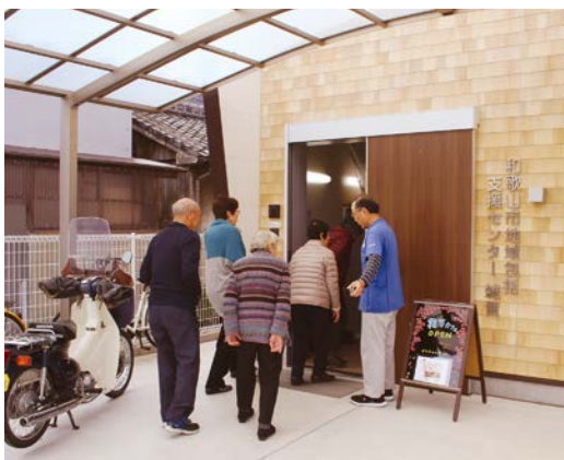
雑賀カフェようこそ!