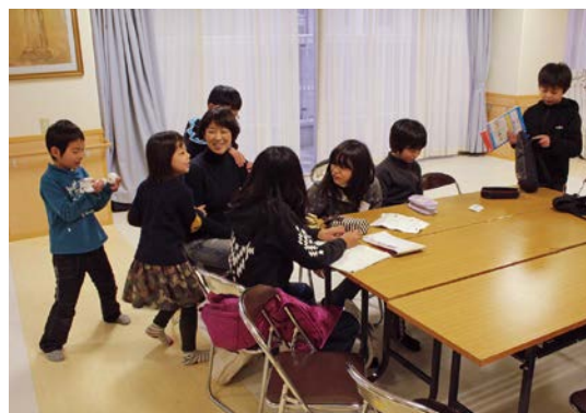
自習の様子。ボランティアさんに教えてもらいながら…。

平成26年度からは法人内に「地域貢献委員会」を設置。地域の子育て支援について何かできないかと検討を重ね、子ども食堂を実施することになりました。