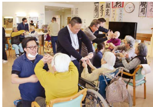
笑顔で健康! ～ラフターヨガ～

このような活動を継続し、住民との距離を縮めることが大事です。今後は相談会を増やすなど、地域の方々の声・ニーズを拾う機会を増やし、福祉課題・生活課題の解決へと結びつけることができるよう、様々な視点・方向性を模索しながらすすめていきたいと思います。