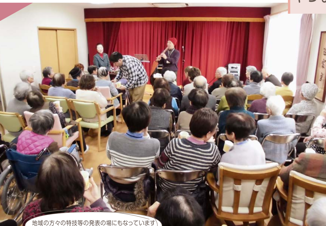
地域の方々の特技等の発表の場にもなっています ～地元の尺八演奏家ボランティア～