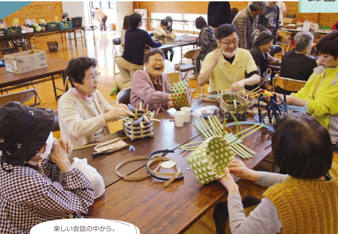
楽しい会話の中から、 様々な課題が見つかります