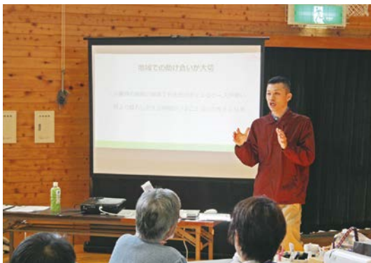
この日は施設職員による防災講座