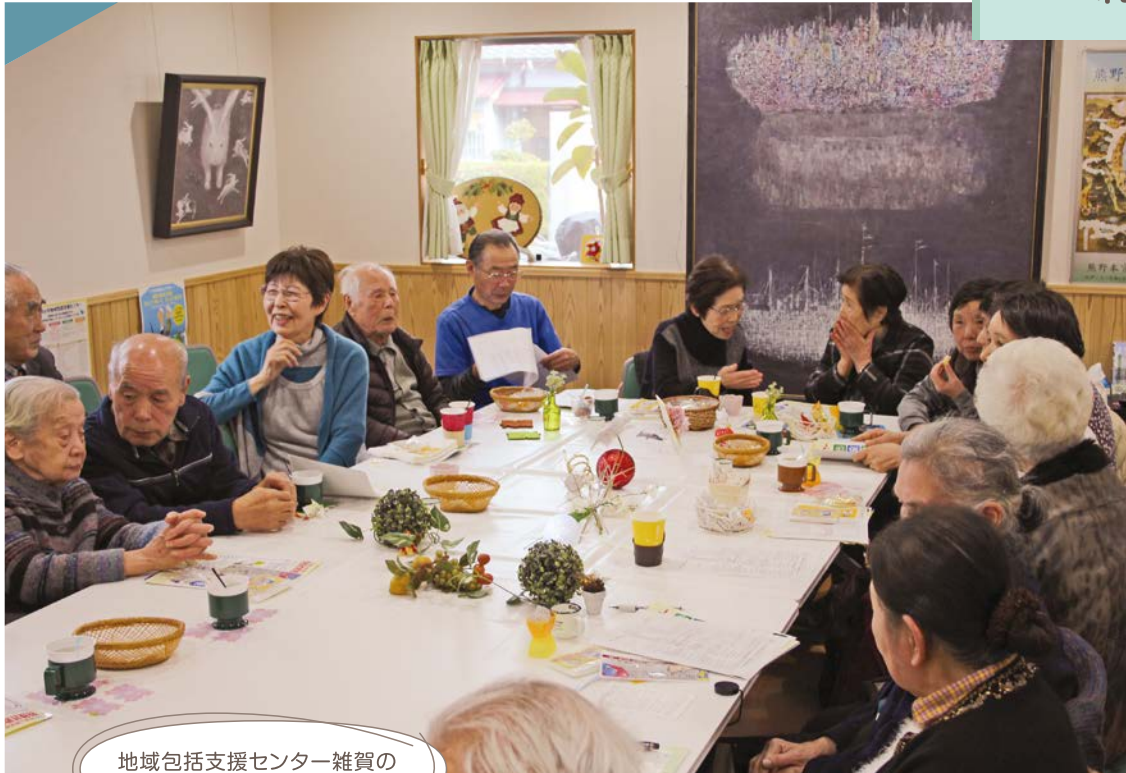
地域包括支援センター雑賀の1階フロアを活用