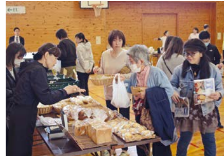
出張販売店でのお買い物

串本福祉会は、昭和61年に設立され、特別養護老人ホームの他、通所介護や訪問介護等、主に串本町内で総合的な介護サービスを展開しています。