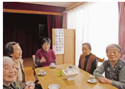
コーヒーの香りにつられ入居者様も…

社会福祉法人やつなみは、平成6年に法人設立認可を受け、和歌山市西庄で老人デイサービスや認知症高齢者グループホーム等の老人福祉事業を運営しています。地域の小・中・高校や特別支援学校等との連携を図るなかで、地域課題は介護問題だけでなく、障害者(児)、ひとり親家庭の育児、多年齢層にわたるひきこもりの課題等、悩みを抱える世帯は本当に多数あり、地域に気軽に立ち寄れる