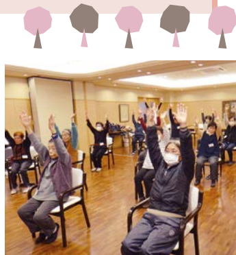
カフェの前に介護予防の体操を実施しています