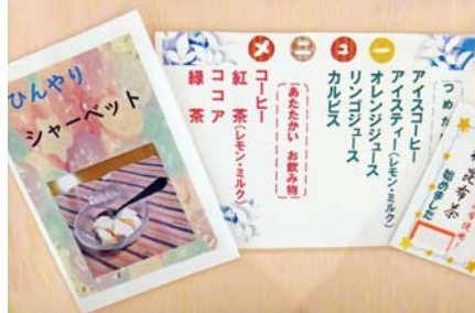
多彩なメニューを用意し、4品まで注文できます