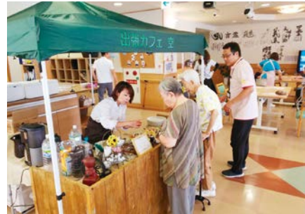
高齢者施設専門出張カフェ 空