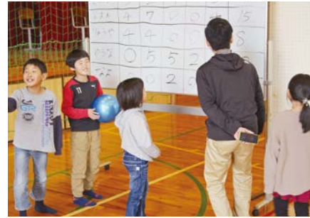
子供が集まると一気に賑やかに