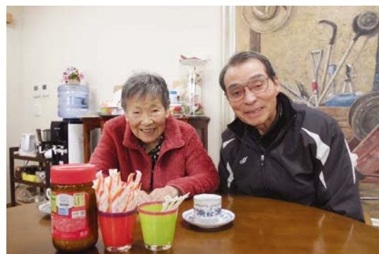
この日も常連さんが訪ねてきてくれました (左:入居者様、右:カフェの常連さん)

このカフェでは、施設内の地域交流スペースを毎週木曜日に開放。介護予防や認知症相談はもちろん、公共機関や地元ボランティアの協力を得て、料理教室や防災講座等のイベントやレクリエーション要素も含めながら、誰もが参加・交流・学ぶことができる居場所を目指しています。