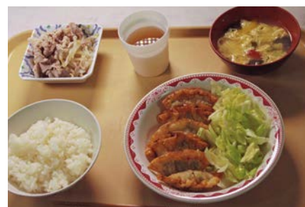
本日のメニューは揚げ餃子。食材のほとんどは寄附いただいたものです。