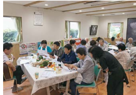
ギター演奏と歌声カフェ

社会福祉法人わかうら会は、平成7年に設立され、特別養護老人ホームの他、ショートステイやグループホーム等、総合的な介護サービスを展開しています。基本理念の一つに“地域と共に歩み、地域に愛され信頼される、地域の拠点として成長し続ける施設を目指す”とあり、これまでも地域の交流を支える取組を進め