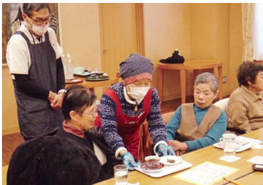
地域の方もボランティアでお手伝いしてくれています

以前から地域で気がかりであった認知症が疑われる独居高齢者がカフェに参加され、カフェを通じて相談支援・サービス提供につながったケースもあります。このカフェの他に、グループホーム等でもカフェや喫茶カラオケを実施しており、今後も地域を支える“居場所”として、継続したいと思っております。