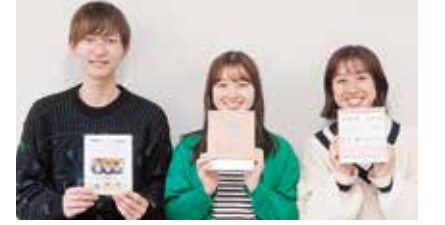
和歌山大学経済学部 ライクアス

製品から想いを伝える 『ノートラブル』の名前には、「問題を無くす」という意味の他、「ノート」と「ラブ(愛)をかけ合わせ、「愛情をもって筆談する」という想いを込めています。