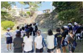
学生と共に活動する様子

そのように思っていたところに、友人から清掃ボランティア活動をしたい、という声を聞き、ボランティア団体を探したところ、周囲で見つけることができませんでした。それなら若者の自分たちが、自由に活動できるようにと、令和3年6月に「クリーン&コネクト和歌山」を立ちあげました。友達4人ではじめた活動ですが、今では40人、多い時は70人ほどが参加する活動へと広がり、定例清掃のほか、学校の校外学習、総合学習などを利用して学生と取り組んだり、企業と共に活動をしたりすることもあります。