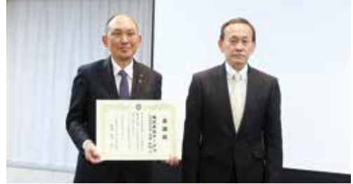
※商品寄贈による社会福祉貢献活動 寄贈品に関する協定(令和3年8月、株式会社オークワ様、県社協で締結)

寄贈いただいた商品は、各市町村社協の協力により、社会福祉施設・団体、こども食堂を運営するボランティア団体・NPO法人等に配分し、地域福祉の推進のため活用されています。