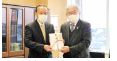
株式会社テレビ和歌山 大越代表取締役社長(写真右)

県域での社会福祉事業の進展に資するために、本会にご寄附いただきました。心から御礼申し上げます。