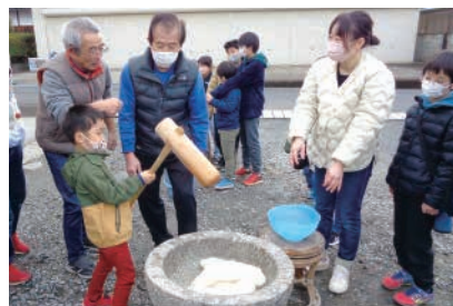
お餅つきで地域交流