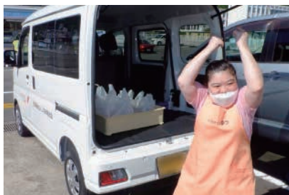
移動販売車両購入で売上アップ！