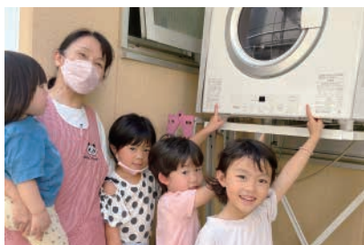
乾燥機購入でいつも清潔！