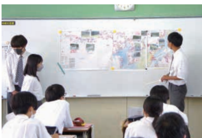
学校での防災学習