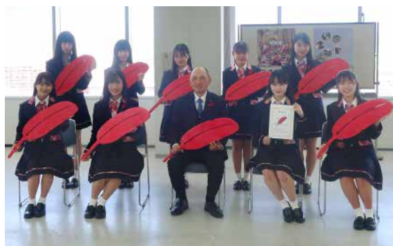
感謝状を贈呈させていただきました。(令和5年3月28日)