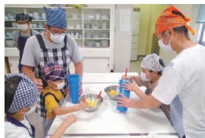
実験！サイエンスクッキング