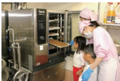
レパトリーが増えてみんな笑顔に！