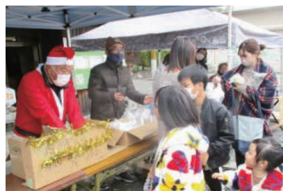
フードパントリー