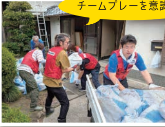
チームプレーを意識して