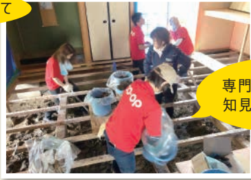
専門ボランティアの 知見・技術をつなぐ