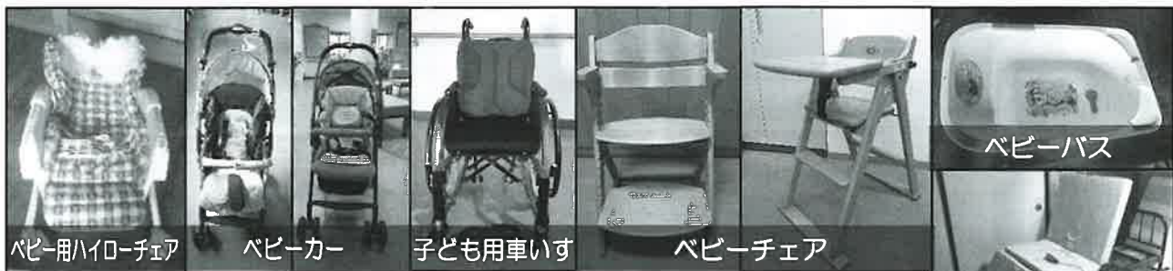
ベビー用ハイローチェア