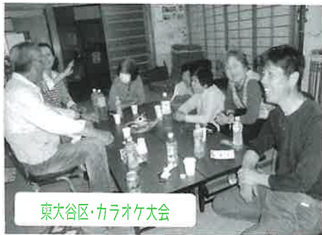
東大谷区・カラオケ大会