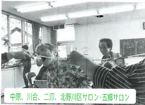
中原、川合、二瀬、北野川区サロン・五郷サロン