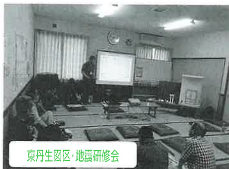
東丹生図区・地震研修会