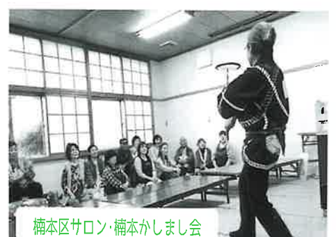
楠本区サロン・楠本かしまし会