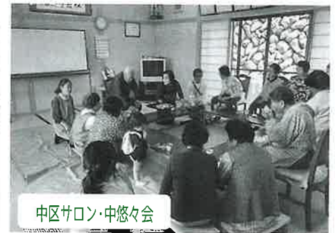
中区サロン・中悠々会