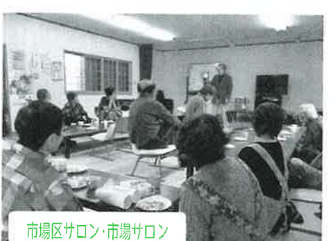
市場区サロン・市場サロン

【お問合せ先】有田川町住民活動センター（社会福祉協議会内） TEL：0737-23-8800