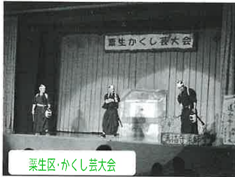
粟生区・かくし芸大会

地域で行なわれている「住民交流」「サロン」活動のうち、2019年度に助成金の申請をされた活動のいくつかをご紹介します。毎年行なっている活動もあれば、今回初めて行なわれた活動もあります。多くの地域で様々な楽しい交流が進められています。