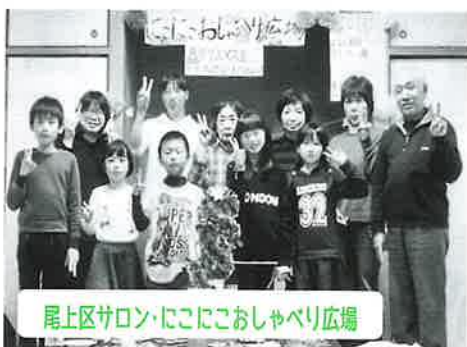
尾上区サロン・にこにこおしゃべり広場