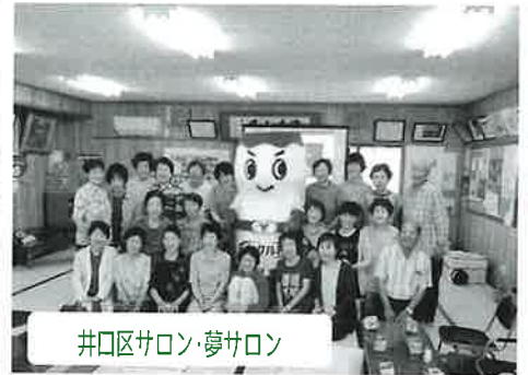
井口区サロン・夢サロン