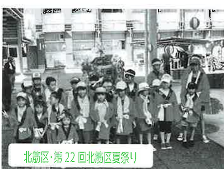
北筋区・第22回北筋区夏祭り