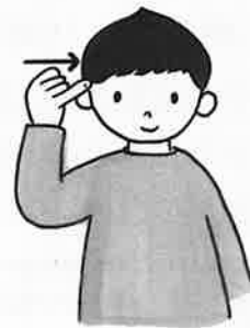
③右手小指の指先をこめかみにあてる