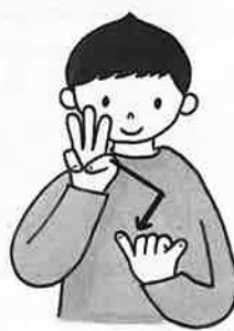
②立てた左手2指の上に右手3指で「く」形を描き