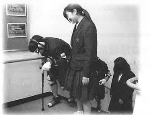
高齢者疑似体験の様子

1年生は認知症の原因や症状を学び、高齢者疑似体験を通してお年寄りの気持ちやサポートの方法を考えました。〈生徒の感想より〉私の家にはおばあさんがいます。体験してみて、階段や坂を「苦しい」と言っているのぼっているおばあさんの気持ちがよく分かりました。おばあさんを私たち家族が温かく見守ることが大事だと思います。