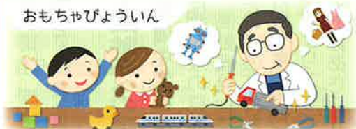
おもちゃびょういん

壊れたおもちゃ、動かなくなったおもちゃを修理する「おもちゃ病院」のドクターを募集します。