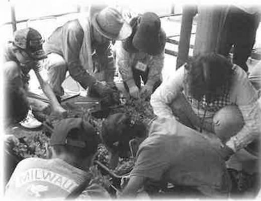
ポットへの移植の様子

中山路小学校では5・6年生が、「花の種まき、移植、宅配ボランティア」に取り組んでいます。4月に花の種をまき、保護者や地域の方々に手伝っていただきながらポットに移植して育てました。7月には校区内の全戸を一軒一軒回って、花の宅配を行いました。直接家に足を運ぶことで、地域の高齢者とのふれあいを深めました。