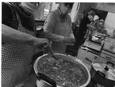
「カレーはうす」プレオープン

また、市から、「生活支体制整備事業」を受託し、第2層生活支援コーディネーターを配置し、各地区での地域課題の把握に努めました。モデル地区として、初島地区の有志による「チーム六桜花」を結成し、高齢者のニーズ把握するための場作りや、港老人クラブでの地区内の1人暮らしの方で一定条件を満たす方を対象に月2回「見守り活動」の立ち上げ支援などを行いました。