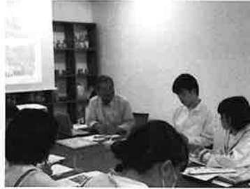
箕島高校の課題研究授業の様子