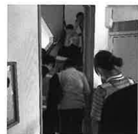
事業所間避難訓練 シェアリング