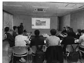
被災地への視察研修

毎月1回、地域福祉ネットワーク会議(有田市地域協働促進会議)において、地域の福祉課題、生活課題についての話し合いの場を持ち、令和元年度においては「災害時の事業所自助力強化と事業所間連携及び地域との協働の在り方」をテーマに、被災施設への視察研修や、事業所間避難訓練シェアリング等を実施しました。