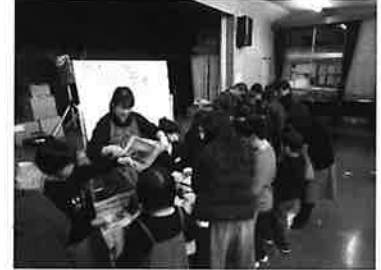
モデル事業から 「マモッチャクラブ」誕生