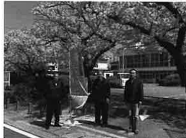
初島地区「チーム六桜花」