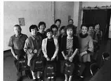
港老人クラブ「見守り活動」