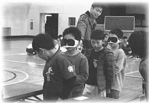
アイマスク体験の様子

また、盲導犬と生活をともにする方のお話を聞いて、視覚障がいをもつ方の生活と盲導犬について理解を深めることができました。