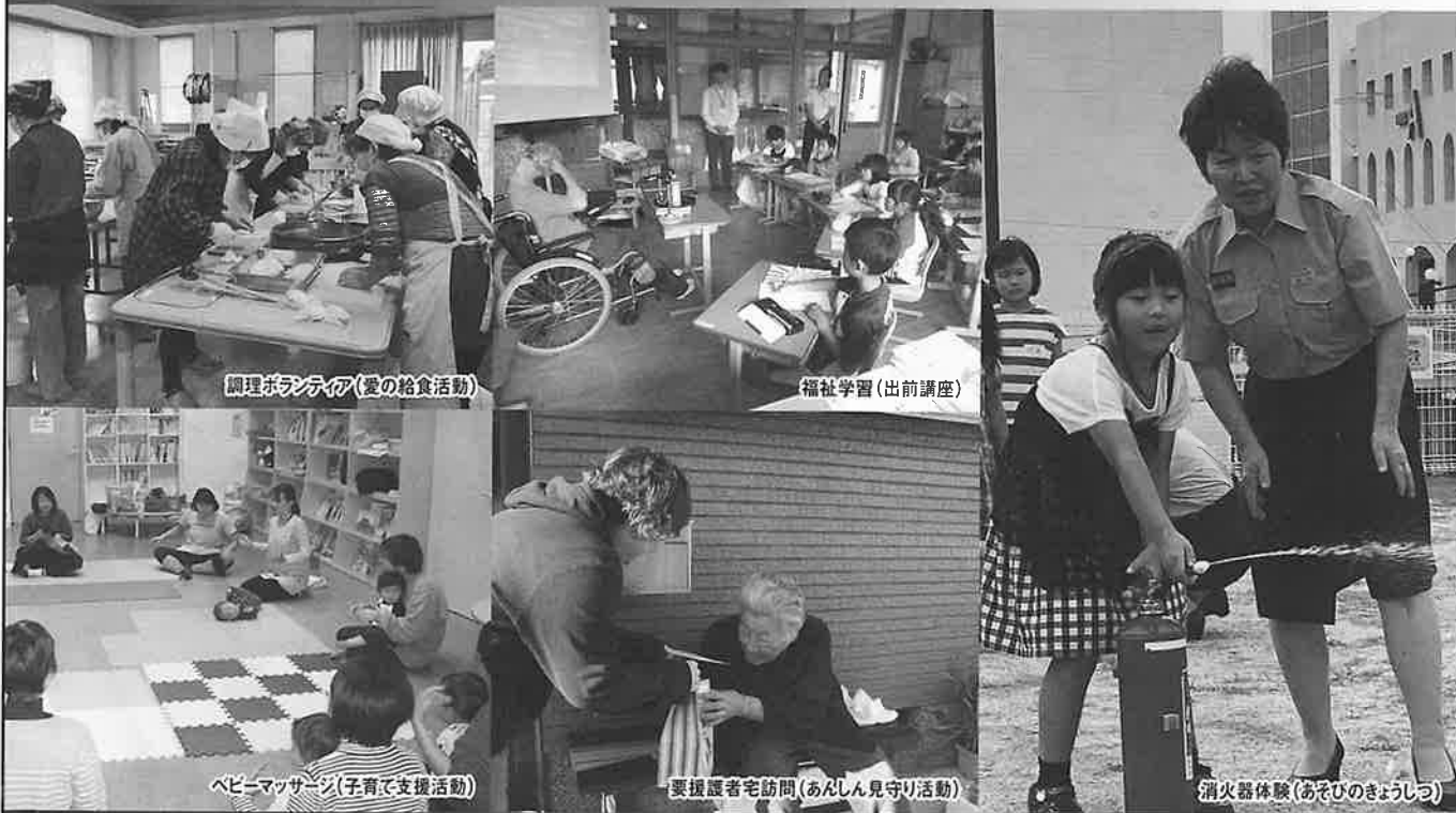
調理ボランティア(愛の給食活動)