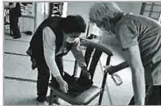
西丹生図区いきいき百歳体操 消毒を徹底しています イスも重りもトイレのノブも