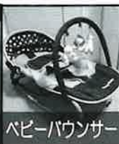
ベビーバウンサー