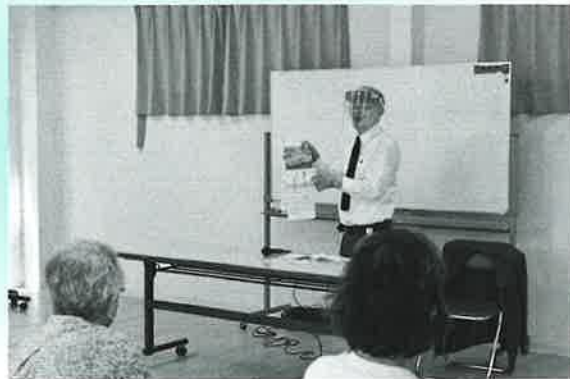
講師もフェイスガードでお話