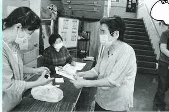
今回はロビーにてお菓子などの配布のみ