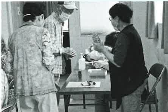
受付でマスク・アルコール消毒の徹底!!