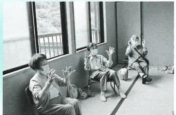
広い間隔をとり、みんなで指の脳トレ