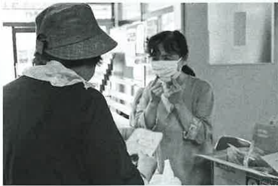
久しぶりに再会し笑顔 (*^-^*)