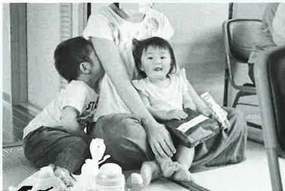
小さな参加者も...♡ お誕生日でした♪