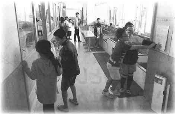
アイマスク体験の様子

アイマスク・ガイドヘルプ体験を通して、私たちが普段何気なく過ごしていることも、大変なことがあることを学びました。相手の気持ちになつて考えることの大切さやユニバーサルデザインの物がたくさんあることをあらためて知るいい機会になりました。