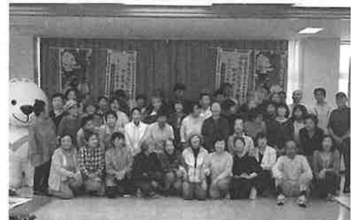
地域のボランティアリーダーとなる人材を育成する取組です。ねんりんピックのボランティアとしても活動しました。