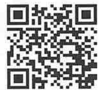
【申込 QR コード】