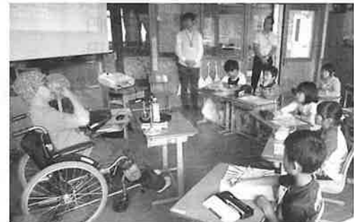
障害のある方と出会い、直にお話を聞くことは豊かな福祉観を育むための経験となります。