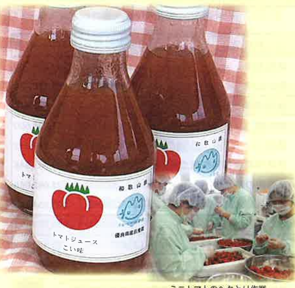
ミニトマトのヘタとり作業

プレミアムな トマトジュース 和歌山県の名産品として「プレミア和歌山」にも選ばれた逸品。美味しさの秘訣は、地元産の糖度の高いミニトマトを使用することと、すべての工程において妥協せず品質管理に取り組んでいること。素材の味を生かした甘くて濃厚な味わいが人気です。安心・安全で、質の高い製品が信頼され、みなべ町のふるさと納税返礼品にも使われています。贈り物にも喜ばれています。 【販売場所】産直市場よって、ほんまもんふるさと産地直売所 【お問合せ】なかよし作業所 みんなの食品ひだまり 電話 0739・72・5820