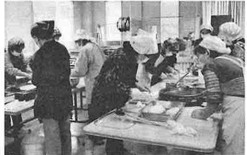
ひとり暮らしの高齢者等にてづくりのお弁当を届けます。安否確認の役目も兼ねています。