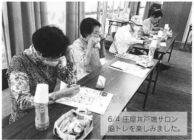
6/4 庄屋井戸端サロン 脳トレを楽しみました。

新型コロナウイルス感染症の緊急事態宣言が解除され、サロン活動やボランティア活動などが徐々に再開されていますが、まだまだ油断できない日々が続いています。「新しい生活様式」をふまえ、ひとりひとりが感染予防に努めながら共に地域活動を行いましょう。