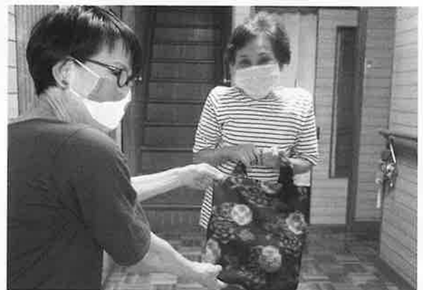
7/9 食事サービス配食時にお配りしました。

このほど、新婦人の会貴志川支部いちご班の皆さんが着物や帯、カーテンの布などを利用して作ったバッグを貴志川支所へ届けてくれました。このバッグは、新型コロナの影響で増えた自宅で過ごす時間を有効に使って作成されたもので、管内の食事サービス利用者約120人に届けられました。