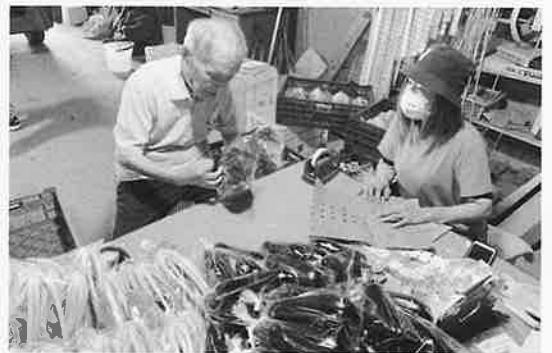
6月下旬利用者3名がレクリエーションとして、だいち農園の倉庫でシール貼りや袋詰めに取り組みました。

ほほえみの里の大原センター長は、「『農家から福祉施設へ』『福祉施設から地域へ』と繋がる第一歩となりました。また、「ご利用者さまの楽しみのひとつとして今後このイベントを開催したい。」と話してくれました。