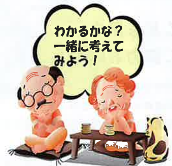
解答は次号に掲載します。