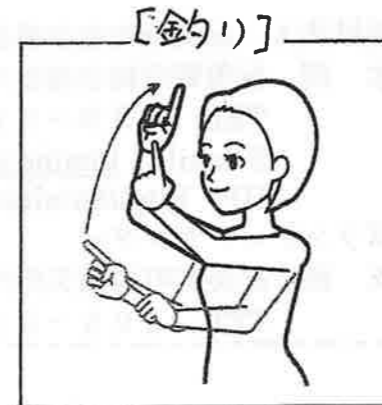
両手人差し指を伸ばし「フナ」合わせ、振り上げる