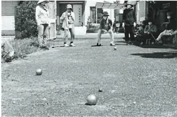
みんなでペタンク♪