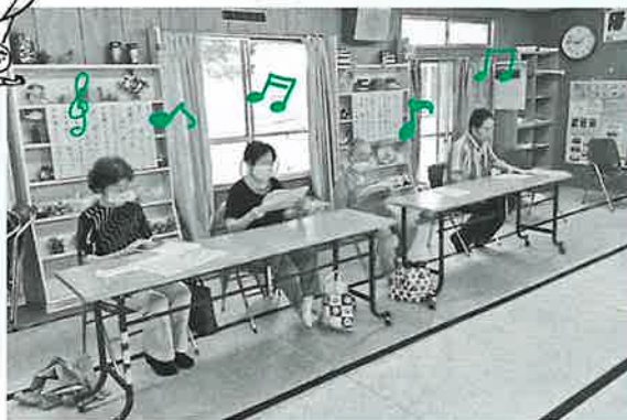
隣との距離を保ちきれいな歌声♪