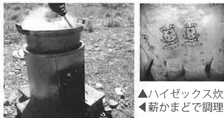
▲ハイゼックス炊飯 ◀薪かまどで調理