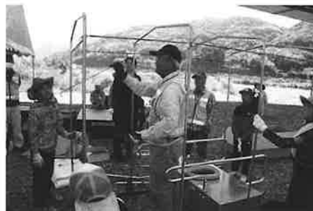
子どもたちも熱心に組み立ててくれました(昨年の様子)