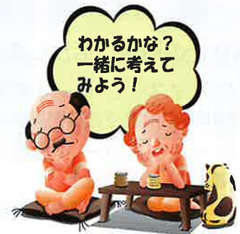
解答は次号に掲載します。

ちん・ が・ よう しゅ・ もろ・ ぎく とう・ き・ いや らっ・ げん・ こし もろ・ ん・ さい ばれ・ れん・ らし とう・ い・ しよ ほう・ へ・ そう