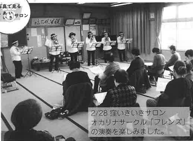
2/28 いきいきサロン オカリナサークル「フレンズ」 の演奏を楽しみました。