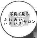
photo de salon