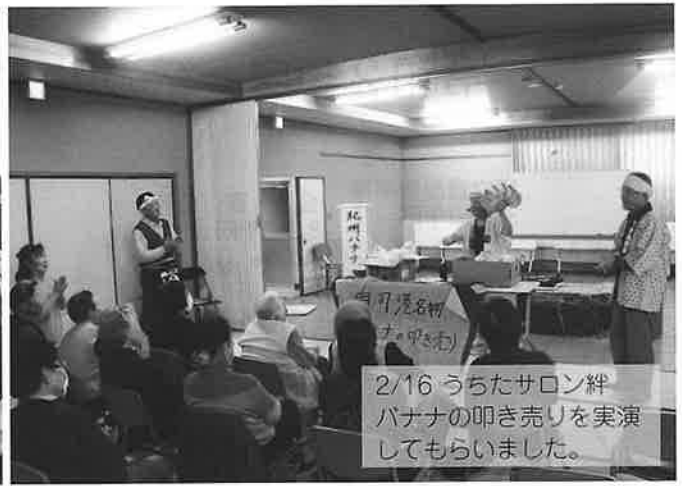
2/16 うちたサロン絆 バナナの叩き売りを実演 してもらいました。