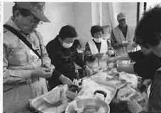
災害ボランティアセンター 設置運営訓練