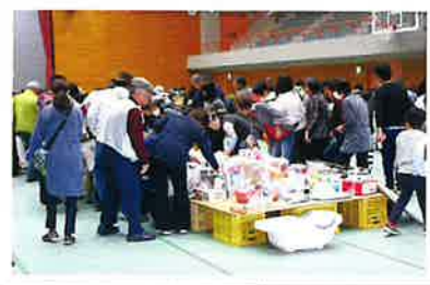
チャリティーバザーの様子