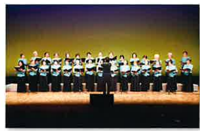
学園祭 発表の部 (コーラスクラブ)