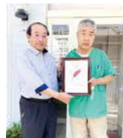
田辺市の初山歯科医院様よりご厚志を賜りました。

歯科医師として、地域の住民として、様々な形で地域の福祉のために貢献をされている中、共同募金にもご協力を頂きました。ありがとうございます。