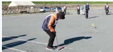
ゲートボール(野口ゲートボール場)