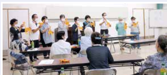
3人で少しずつ紙をちぎってキリンを作成

高齢者の孤立や引きこもりなどを防ぐために、地元で身近な場所に集まり、仲間づくりの拠点となる高齢者サロンの充実と立ち上げを行う人材を養成しています。