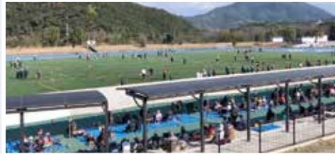
グラウンド・ゴルフ(南山スポーツ公園)