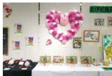
昨年度のふれあい作品展(紀伊松風苑)