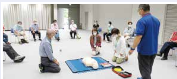
皆で力を合わせて救命講習

高齢者による地域の見守りや支え合い活動・サロン・グループ活動を行う人材を養成するため、県内3校で開催しています。