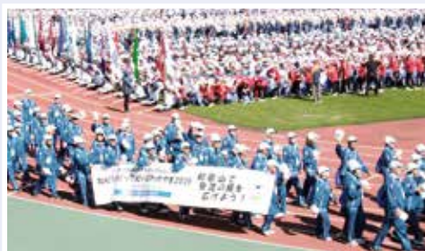
ねりんピック紀の国わかやま2019開会式の行進

今年度は、『第34回全国健康福祉祭神奈川・横浜・川崎・相模原大会(ねりんピックかながわ2022)』が、11月12日(土)~11月15日(火)で開催されます。