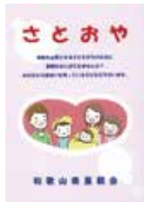
県里親会/パンフレット

県では令和2年3月に「和歌山県社会的養育推進計画」を策定し、令和11年度までに里親委託率を今の約20%から44.1%まで伸ばすこと、里親登録数も270世帯まで増やすことを目指しています。里親になるには認定研修を受講し里親登録をする必要がありますが、特別な資格が必要なわけではありません。登録さえしておけば、なりたいたいときにいつでも里親になることができます。「普通の家庭に子どもを迎え入れ、当たり前前の生活を共に過ごす」それが子どもの成長に大きな影響を与えます。一人でも多くの方の登録をお待ちしています。