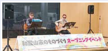
わかちか広場(JR和歌山駅西口地下)での活動

長年培ってきた知識・経験や資格・技能を活かして社会参加したいという高齢者に「わかやま元気シニア生きがいバンク」へ登録いただき、Web等で情報を発信するとともに、そうした人材を求める企業・団体・学校などのマッチングを行うことで、活動の場を提供し、高齢者の生きがいや健康づくりに繋げていきます。