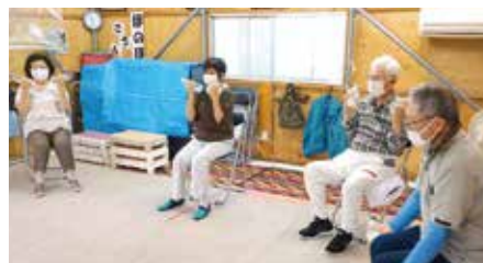
②「ほのぼのサロン」/楽しく健康体操