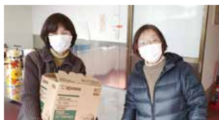
①「平瀬カフェ」/カフェで使う電気ポットを届けました

密を避け、健康体操を週3回、1回6～7名で開催。毎回会のメンバーにあった体操を取り入れています。場所は府中御坊自治会館。