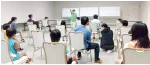
夏のレクリエーション

更に児童相談所や行政と連携し、学校や地域に対して養育を必要とする子どもへの理解を求める啓発等を行い、里親と子どもをチームとして支えていくことを意識して活動しています。このような取組が、里親だけでなく子どもを守る支援にも繋がると考えています。