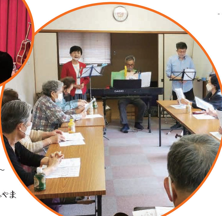
「みんなのサロン」 ～地域交流サロン～