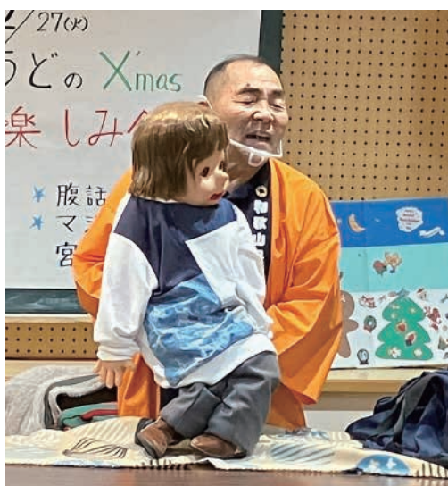
活動の様子（和歌山県腹話術協会）

和歌山県いきいき長寿社会センターは 生きがいと健康づくり、仲間づくり、 社会参加活動を行う高齢者を 応援 します