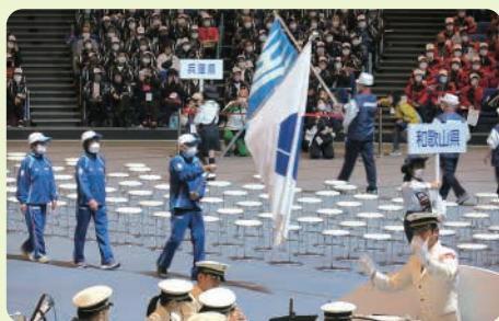
ねんりんピック県選手団入場行進