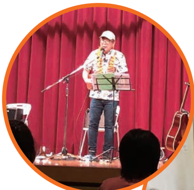
「サロンアルゴノーツ」 ～ミュージックワーク ショップ～

「地域活動をすすめるうえで使えるレクリエーション ～無理なく楽しくできるレクリエーション～」から「ちょうだい体操」