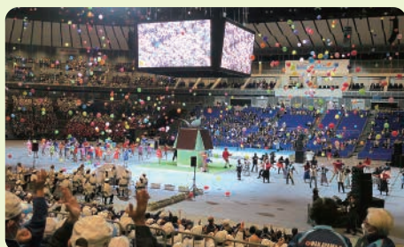
総合開会式式典の様子