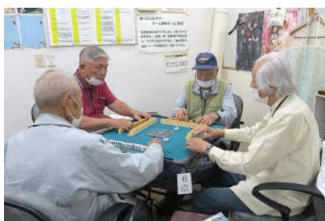
健康マージャン大会